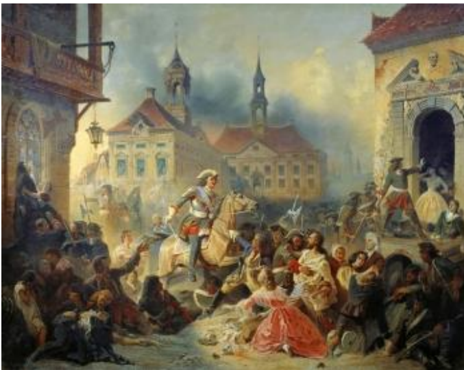
Зауервейд Николай Александрович. Пётр I умиряет ожесточенных солдат своих при взятии Нарвы в 1704 году. Холст, масло. 169x214. 1859. Государственная Третьяковская галерея

Северная война 1700-1721 – затяжной конфликт между Швецией и Северным союзом за обладание прибалтийскими землями.